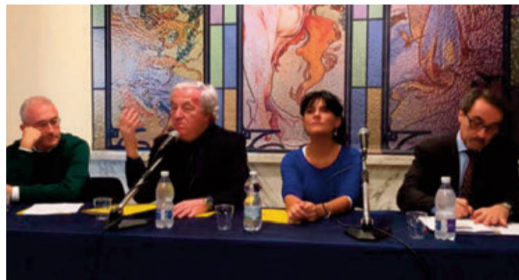
● La presentazione della nuova rassegna dello Stabile di Napoli

Il terzo appuntamento è previsto a gennaio, esattamente lunedì 14, al Ridotto del Mercadante alle ore 21 con "Dissonanzen 2019-La forza del dialogo-Gli strumenti e