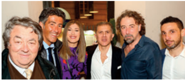
Alcuni momenti della festa di compleanno con i numerosi ospiti intervenuti al "Blackwood"