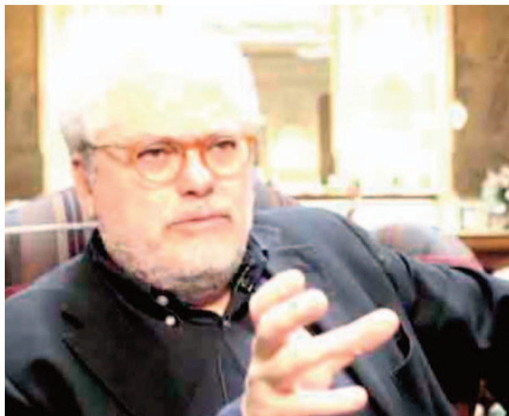
Roberto Andò direttore artistico del Teatro Stabile di Napoli

Dal 26 al 31 ottobre al San Ferdinando andrà in scena "Occhi gettati-Un de-coupage, 34 anni dopo", su testo, ideazione scenica e